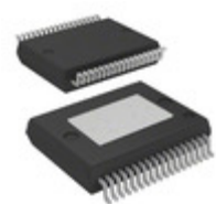
VNI8200XP STMicroelectronics IC SMART PWR SSR POWERSSO36