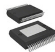
VNI8200XPTR STMicroelectronics IC SMART PWR SSR POWERSSO36