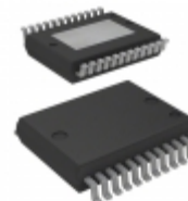
VNI4140KTR STMicroelectronics IC SMART PWR QUAD HISD PWRSSO24