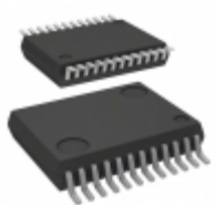
VNI4140KTR-32 STMicroelectronics IC HIGH SIDE 4CH SSR POWERSSO24