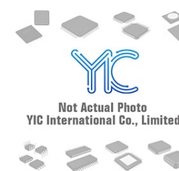
BD429 DEI DEI DIP-16