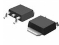
BD433M5FP-CE2 LAPIS Semiconductor IC REG LINEAR 3.3V 500MA TO252-3