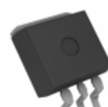
BD433M5FP2-CZE2 LAPIS Semiconductor IC REG LIN 3.3V 500MA TO263-3F