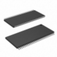
CY14B116N-ZSP45XIT Cypress Semiconductor Corp IC NVSRAM 16MBIT 45NS 54TSOP