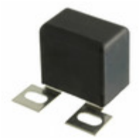
MKP386M447100JT5 Vishay BC Components CAP FILM 0.47UF 5% 1KVDC SCREW