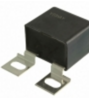
MKP386M447070JT7 Vishay BC Components CAP FILM 0.47UF 5% 700VDC SCREW