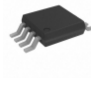
ADG722BRM Analog Devices Inc. IC SWITCH DUAL SPST 8MSOP