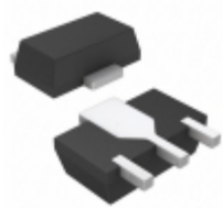
HMC452ST89ETR Analog Devices Inc. IC MMIC AMP HBT 1W SOT-89