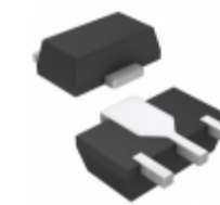
HMC453ST89E Analog Devices Inc. IC MMIC AMP HBT 1.6W SOT-89