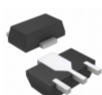
HMC453ST89ETR Analog Devices Inc. IC MMIC AMP HBT 1.6W SOT-89