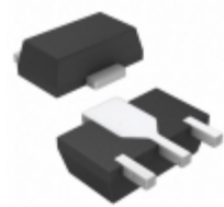
HMC453ST89TR Analog Devices Inc. IC MMIC AMP HBT 1.6W SOT89