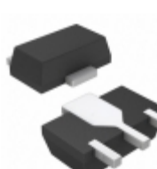
HMC452ST89TR Analog Devices Inc. IC MMIC PWR AMP HBT 1W SOT89