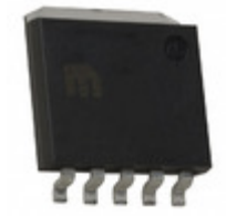
MIC37152BR Microchip Technology IC REG LDO ADJ 1.5A SPAK-5