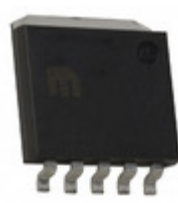
MIC37151-3.3WR Microchip Technology IC REG LDO 3.3V 1.5A SPAK-5