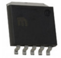
MIC37151-3.3BR TR Microchip Technology IC REG LDO 3.3V 1.5A SPAK-5