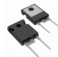
VS-60EPU04HN3 Electro-Films (EFI) / Vishay DIODE GEN PURP 400V 60A TO247AC