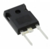
VS-60EPU06-N3 Electro-Films (EFI) / Vishay DIODE GEN PURP 600V 60A TO247AC