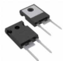
VS-60EPU06P-S1 Vishay Semiconductor Diodes Division DIODE GEN PURP 600V 60A TO247AC