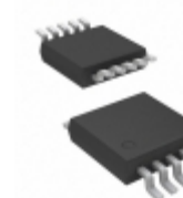
MCP73841T-410I/UN Microchip Technology IC CONTROLLER LI-ION 4.1V 10MSOP