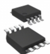
MCP73843-410I/MS Microchip Technology IC CONTROLLER LI-ION 4.1V 8MSOP