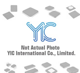
MCP73843-420 Microchip Microchip MSOP