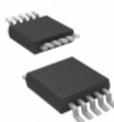
MCP73842-820I/UN Microchip Technology IC CONTROLLER LI-ION 8.2V 10MSOP