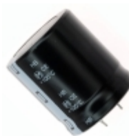
ECO-S2GB391EA Panasonic Electronic Components CAP ALUM 390UF 20% 400V SNAP