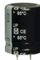
ECO-S2GP121CA Panasonic Electronic Components CAP ALUM 120UF 20% 400V SNAP