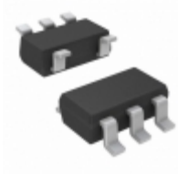
TC1015-2.85VCT713 Microchip Technology IC REG LDO 2.85V 0.1A SOT23-5