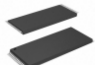
AT49F001N-70TC Microchip Technology IC FLASH 1MBIT 70NS 32TSOP