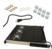
OA302 Orion Fans 3 FAN TRAY 230V 330CFM