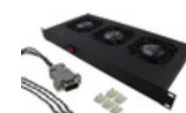
OA300ST-23004 Orion Fans 3 FAN 230V SMART TRAY REMOTE