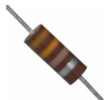
OA331K Ohmite RES 330 OHM 1W 10% AXIAL