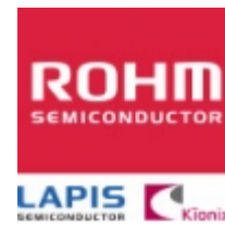
DTC014YM ROHM DTC014YM ROHM