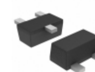
DTC014YEBTL Rohm Semiconductor TRANS PREBIAS NPN 50V 0.15W SC89