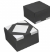
BU2HTD2WNVX-TL Rohm Semiconductor IC REG LDO 2.75V 0.2A 4SSON