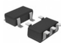
BU2JTD3WG-TR Rohm Semiconductor IC REG LDO 2.85V 0.2A 5SSOP