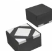
BU2HUA3WNVX-TL Rohm Semiconductor IC REG LDO 2.75V 0.3A 4SSOP