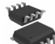
AD8276BRZ-RL Analog Devices Inc. IC OPAMP DIFF 550KHZ RRO 8SOIC