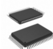
MB89637PF-GT-563-BND Cypress Semiconductor Corp IC MCU 8BIT 32KB MROM 64QFP