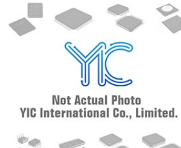
MC33161DMR ON ON MSOP8