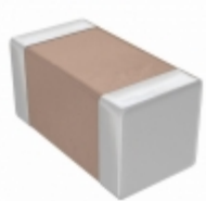
C1005SL1A222J TDK Corporation CAP CER 2200PF 10V SL 0402