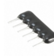
L061S103LF TT Electronics RES ARRAY 5 RES 10K OHM 6SIP