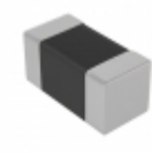
L0603CR39JRMST KEMET FIXED IND 390NH 150MA 2.3 OHM