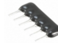
L061S103LF TT Electronics/IRC RES ARRAY 5 RES 10K OHM 6SIP