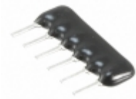
L061S102LF TT Electronics RES ARRAY 5 RES 1K OHM 6SIP