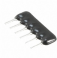
L061S102LF TT Electronics/IRC RES ARRAY 5 RES 1K OHM 6SIP