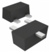
DRC9114T0L Panasonic TRANS PREBIAS NPN 125MW SSMINI3