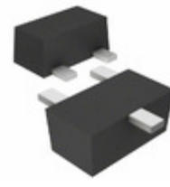
DRC9114E0L PanaVise TRANS PREBIAS NPN 125MW SSMINI3