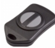
RFD21792 RF Digital Corporation RF TRANSCEIVER 2.4GHZ KEYFOB