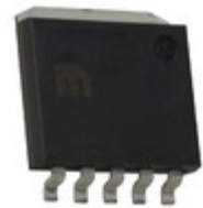
MIC49150-0.9WR Microchip Technology IC REG LDO 0.9V 1.5A SPAK-5