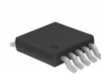
MIC4834YMM Microchip Technology IC DVR DUAL FIXED EL FREQ 10MSOP