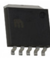
MIC49150-0.9BR TR Microchip Technology IC REG LDO 0.9V 1.5A SPAK-5