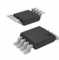
MIC49150-0.9YMM Microchip Technology IC REG LDO 0.9V 1.5A 8MSOP