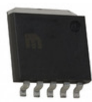
MIC49150-0.9BR Microchip Technology IC REG LDO 0.9V 1.5A SPAK-5