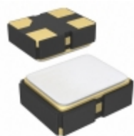
SG-8003CE 7.9875M-PCBL6 Epson OSC XO 7.9875MHZ CMOS SMD