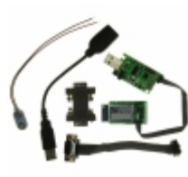
RN-131G-EVAL Microchip Technology EVALUATION KIT FOR RN-131G