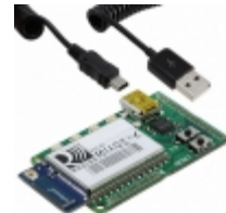
RN-131-EK Microchip Technology RN131 EVALUATION KIT