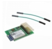
RN-131-PICTAIL Microchip Technology BOARD EVAL RN131