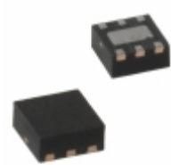
MIC5259-4.75YML-TR Microchip Technology IC REG LDO 4.75V 0.3A 6MLF