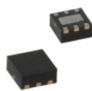
MIC5259-4.75BML-TR Microchip Technology IC REG LDO 4.75V 0.3A 6MLF