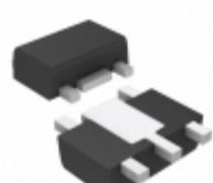
AP7361C-25Y5-13 Diodes Incorporated IC REG LDO 2.5V 1A SOT89-5