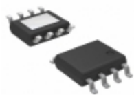
AP7361C-25SPR-13 Diodes Incorporated IC REG LDO 2.5V 1A 8-SO