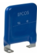
LS40K440QP EPCOS (TDK) VARISTOR 715V 40KA CHASSIS