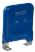
LS40K320QP EPCOS (TDK) VARISTOR 510V 40KA CHASSIS