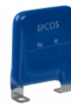
LS40K275QP EPCOS (TDK) VARISTOR 430V 40KA CHASSIS