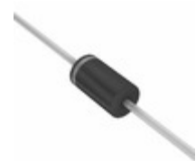
EGP30A-E3/54 Electro-Films (EF1) / Vishay DIODE GEN PURP 50V 3A GP20