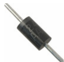
EGP30A Fairchild/ON Semiconductor DIODE GEN PURP 50V 3A DO201AD