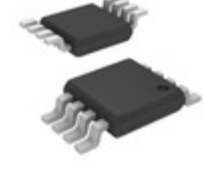
MIC5239-3.15BMM-TR Microchip Technology IC REG LDO 3.15V 0.5A 8MSOP