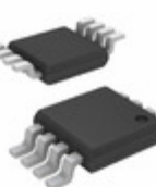
MIC5239-3.15BMM Microchip Technology IC REG LDO 3.15V 0.5A 8MSOP