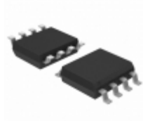
MIC5239-3.15BM-TR Microchip Technology IC REG LDO 3.15V 0.5A 8SOIC