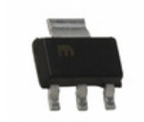
MIC5239-3.15BS Microchip Technology IC REG LDO 3.15V 0.5A SOT223