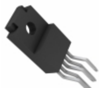
BA05ST-V5 Rohm Semiconductor IC REG LDO 5V 1A TO220FP-5