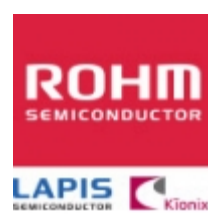
BA06CC0W ROHM BA06CC0W ROHM