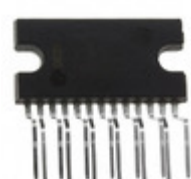
TDA8563AQ/N2C,112 NXP USA Inc. IC AMP AUDIO PWR 55W STER 13SIL