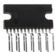
TDA8563Q/N2/S10,11 NXP USA Inc. IC AMP AUDIO PWR 55W STER 13SIL