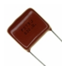
ECQ-P6273JU Panasonic Electronic Components CAP FILM 0.027UF 5% 630VDC RAD