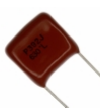
ECQ-P6392JU Panasonic Electronic Components CAP FILM 3900PF 5% 630VDC RADIAL