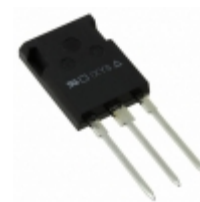
IXGR72N60B3H1 IXYS IGBT 600V 75A 200W ISOPLUS247