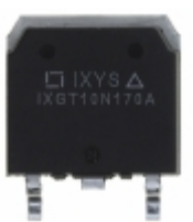
IXGT10N170A IXYS IGBT 1700V 10A 140W TO268