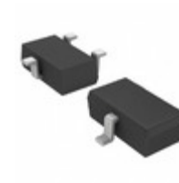
2SAR514RTL Rohm Semiconductor TRANS PNP 80V 0.7A TSMT3