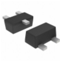
2SAR523EBTL Rohm Semiconductor TRANS PNP 50V 0.1A EMT3F