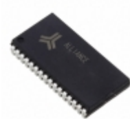
AS7C1024B-20JCNTR Alliance Memory, Inc. IC SRAM 1MBIT 20NS 32SOJ