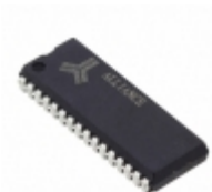
AS7C1024B-15TJINTR Alliance Memory, Inc. IC SRAM 1M PARALLEL 32TSOP I