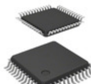
DSPIC33CK128MP205T-I/PT Micrel / Microchip Technology 16 BIT DSC, 128KB FLASH, 16KB RA