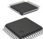
DSPIC33CK128MP205-I/PT Micrel / Microchip Technology 16 BIT DSC, 128KB FLASH, 16KB RA