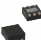
MIC5255-3.3BML-TR Microchip Technology IC REG LDO 3.3V 0.15A 6MLF