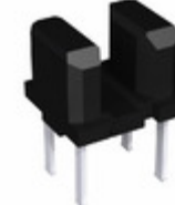
RPI-129BN Rohm Semiconductor PHOTOINTERRUPTER ULTRAMIN HI RES