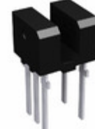
RPI-151 Rohm Semiconductor SENSOR OPTO SLOT 1.5X2.2 MM THD