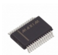
MAX3245ECAI+T Maxim Integrated IC TXRX RS-232 W/SHTDWN 28- SSOP