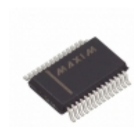
MAX3245ECAI+ Maxim Integrated IC TXRX RS232 1MBPS SD 28- SSOP