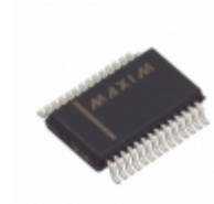
MAX3245ECAI Maxim Integrated IC TXRX RS232 1MBPS SD 28- SSOP