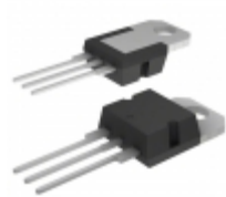
MIC29310-3.3BT Microchip Technology IC REG LDO 3.3V 3A TO220-3