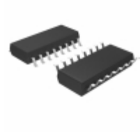
MM74HC4060SJX Fairchild/ON Semiconductor IC COUNTER 14STG BINARY 16-SOP