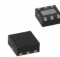
MIC5319-1.85BML-TR Microchip Technology IC REG LDO 1.85V 0.5A 6MLF