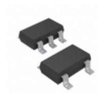
MIC5319-1.85BD5 Microchip Technology IC REG LDO 1.85V 0.5A TSOT23-5