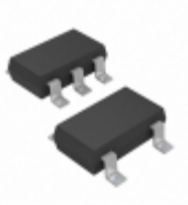
MIC5319-1.85BD5-TR Microchip Technology IC REG LDO 1.85V 0.5A TSOT23-5