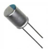
567UER6R3MFF Illinois Capacitor CAP ALUM POLY 560UF 20% 6.3V T/H