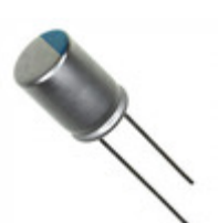
567UER6R3MEF Illinois Capacitor CAP ALUM POLY 560UF 20% 6.3V T/H