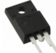
FQPF8N80CYDTU Fairchild/ON Semiconductor MOSFET N-CH 800V 8A TO-220F