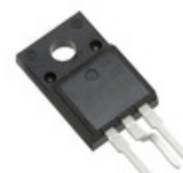
FQPF8N60CYDTU AMI Semiconductor / ON Semiconductor MOSFET N-CH 600V 7.5A TO-220F