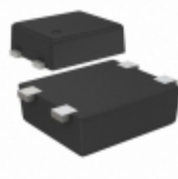
S-80129BLPF-JEOTFU SII Semiconductor Corporation IC VOLT DETECTOR 2.9V SNT-4A