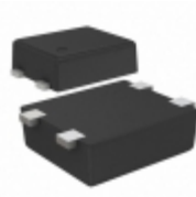
S-80129BLPF-JEOTFG SII Semiconductor Corporation IC VOLT DETECTOR 2.9V SNT-4A