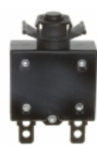
QLB-203-00DNN-3BA Qualtek CIR BRKR THRM 20A 250VAC 32VDC