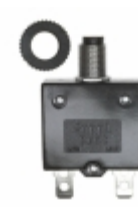
QLB-153-11B3N-3BA Qualtek CIR BRKR THRM 15A 250VAC 32VDC