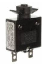
QLB-253-00DNN-3BA Qualtek CIR BRKR THRM 25A 250VAC 32VDC