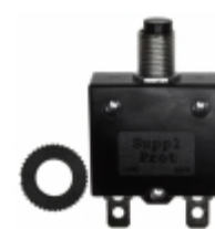
QLB-073-11B3N-3BA Qualtek CIR BRKR THRM 7A 250VAC 32VDC