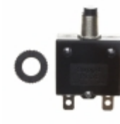
QLB-303-11B3N-3BA Qualtek CIR BRKR THRM 30A 250VAC 32VDC