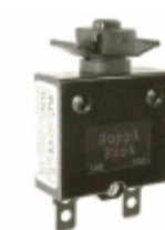
QLB-103-00DNN-3BA Qualtek CIR BRKR THRM 10A 250VAC 32VDC