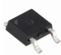
HGTD1N120BNS9A Fairchild/ON Semiconductor IGBT 1200V 5.3A 60W TO252AA