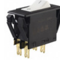
3120-F321-P7T1-W02D-15A E-T-A CIR BRKR THRM 15A 250VAC 50VDC