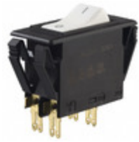
3120-F321-P7T1-W02D-20A E-T-A CIR BRKR THRM 20A 250VAC 50VDC