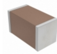
CGA5L1X7R0J226M160AC TDK Corporation CAP CER 22UF 6.3V X7R 1206