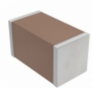
CGA5L1X5R1C226M160AC TDK Corporation CAP CER 22UF 16V X5R 1206